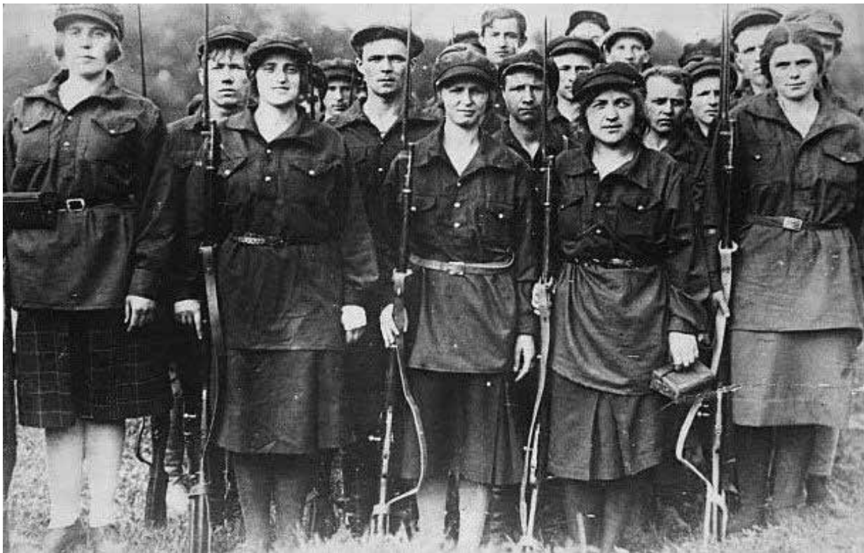
Mujeres en la Guardia Roja en Rusia en 1917

[4] Véase numerosas declaraciones de la CCRI/RCIT en nuestro sitio web (en inglés), http://www.thecommunists.net/worldwide/europe/articles-on-greece/