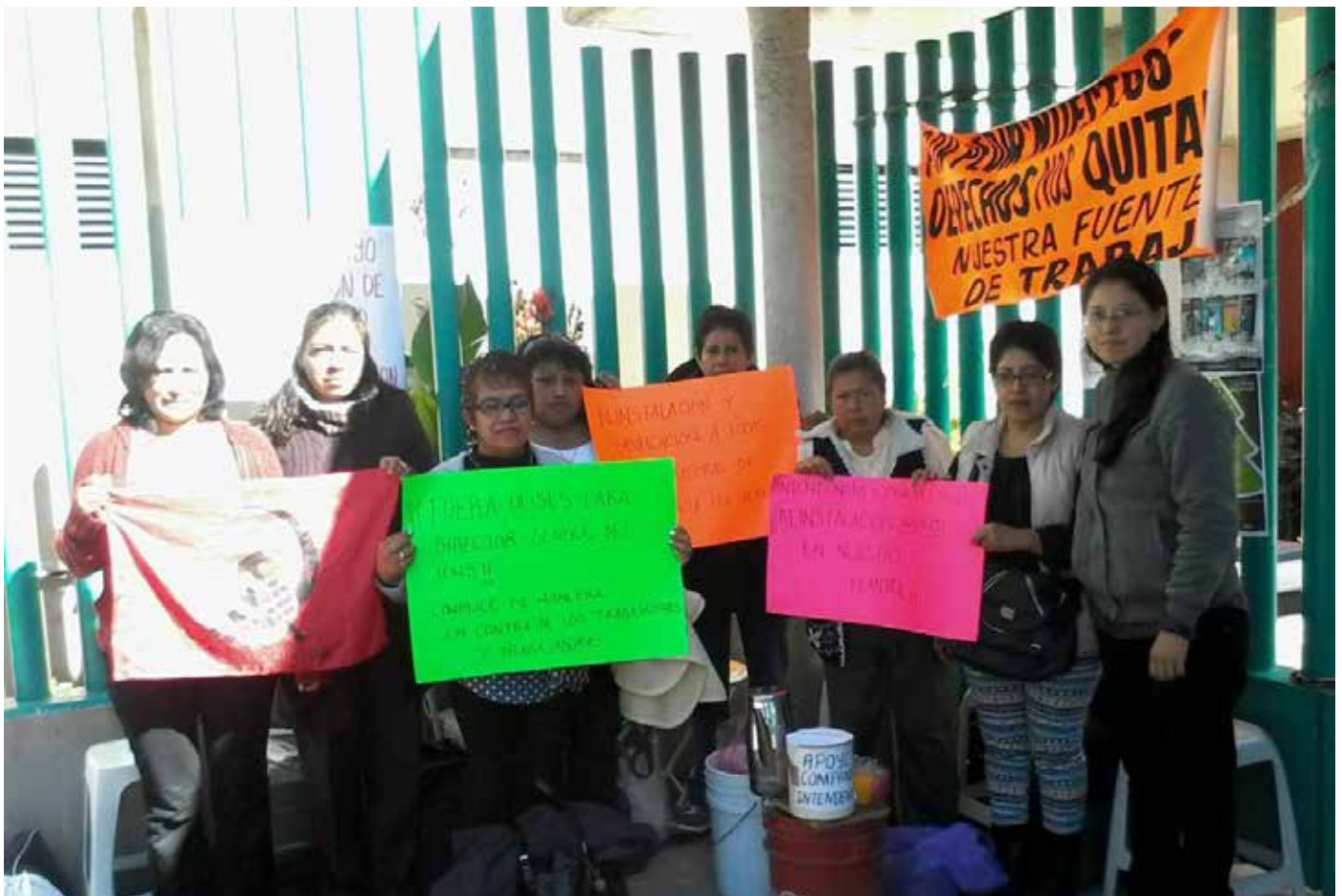
Compañeros de la ALS junto a trabajadoras mexicanas de limpieza del IEMS que están lucha por sus derechos

La necesidad de enlazar las luchas que están ocurriendo actualmente, sobre todo, de desempleados por pelear por sus derechos laborales, por ello, estamos agitando la realización de un Encuentro de Trabajadores, Desempleados y Precarizados contra la terciarización y por la basificación laboral y la sindicalización independiente y democrática.