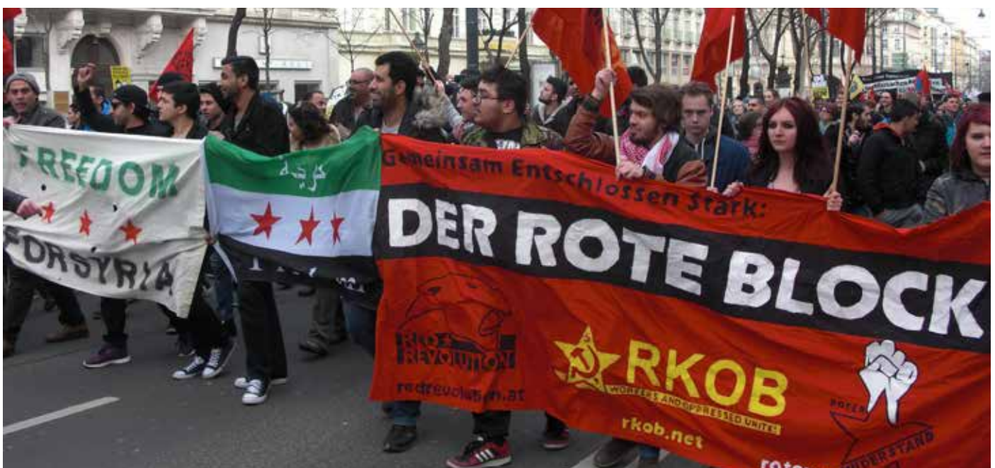
Contingente de la Sección Austriaca de la RCIT en una manifestación en solidaridad con los refugiados el 19.03.16 en Viena

5. Así, los ataques en Bruselas no son ninguna sorpresa. De hecho, la CCRI anticipó hace meses la posibilidad de que ataques como los de París se repitieran. En nuestro documento Perspectivas Mundiales escribimos: "Las potencias imperialistas acelerarán sus intervenciones militares en países semicoloniales -ante todo, en el Norte de África