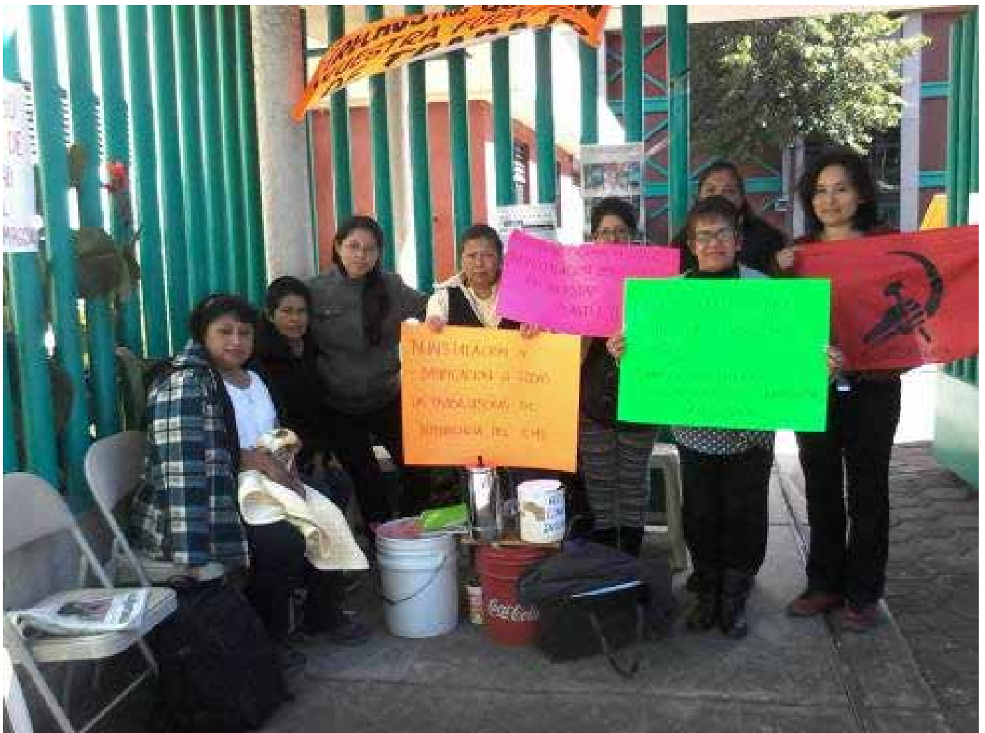
Compañeros de la ALS junto a trabajadoras mexicanas de limpieza del IEMS que están lucha por sus derechos

Seguir leyendo https://agrupaciondeluchasocialista.wordpress.com/eventos/mitin-de-las-trabajadoras-de-intendencia-del-iems/