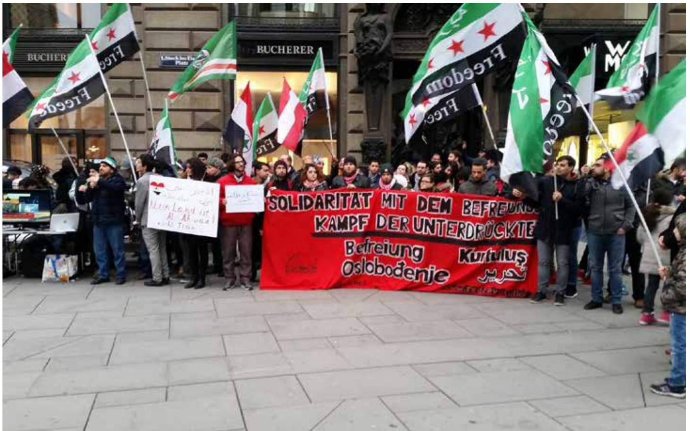
Activistas de la sección de Austria de la RCIT con migrantes sirios en la manifestación en solidaridad con la Revolución Siria el 13.03.16 en Viena

Al mismo tiempo, los gobiernos europeos están ya sea completamente bloqueando o deteniendo a cientos de miles de refugiados sirios que han sido obligados a huir de