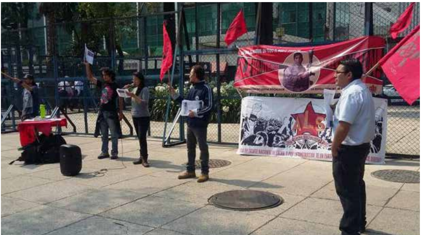
Activistas de la ALS en la manifestación en solidaridad con la Revolución Siria el 15.03.16 en la Ciudad de México

Al cierre de esta edición no se registró detención o choque alguno entre manifestantes y policía de Seguridad Pública.