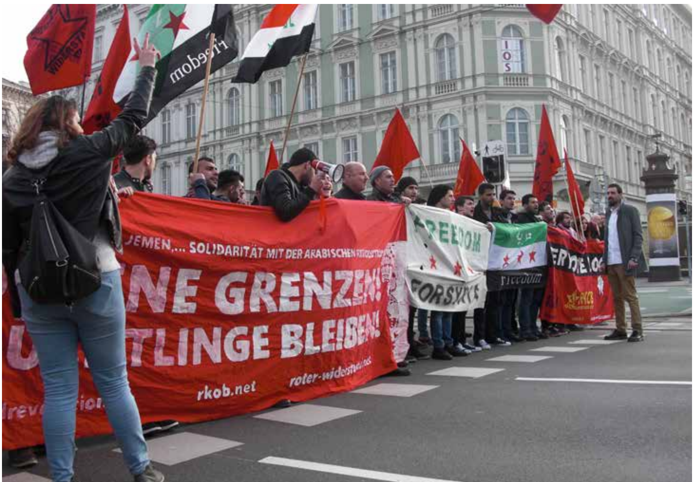
Contingente de la Sección Austriaca de la RCIT en una manifestación en solidaridad con los refugiados el 19.03.16 en Viena

En portugués: CCRI: "El carácter racista de Charlie Hebdo y la campaña pro-imperialista 'Je Suis Charlie'", http://www.thecommunists.net/home/portugu%C3%AAs/racist-charlie-hebdo/