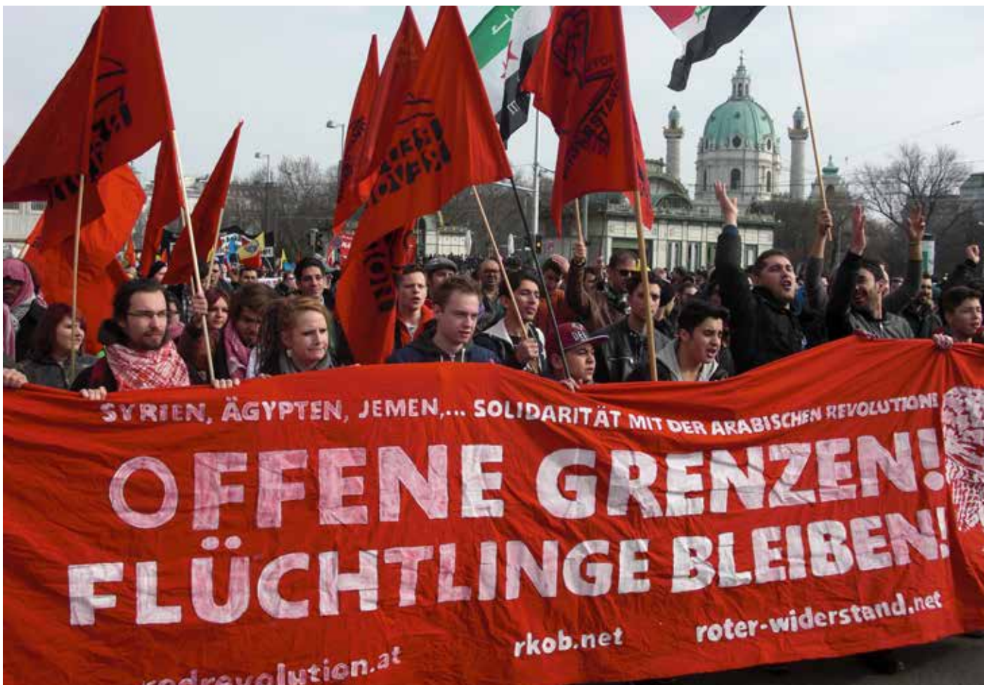
Contingente de la sección Austriaca de la RCIT con mantas que dicen: ¡Fronteras abiertas! ¡Refugiados se quedan con nosotros!

15. Esta lucha contra el social-chovinismo es ahora de suma importancia. Las principales fuerzas reformistas (so-