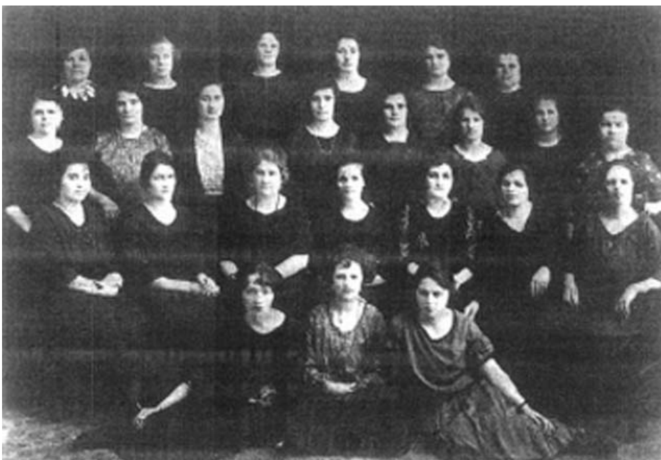
Consejo editorial de Ravonitska, periódico de las mujeres bolcheviques

¡Por un 8 de marzo clasista combativo y revolucionario!