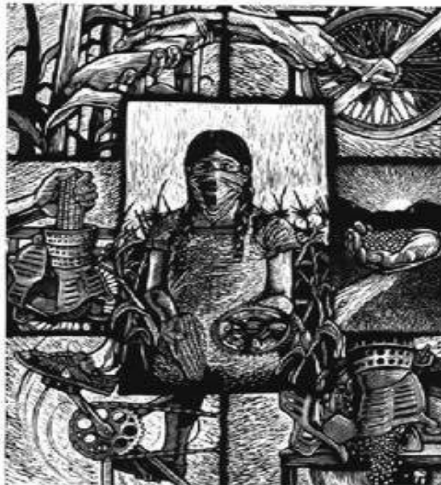
Grabado / Gráfica Mazatl

¡ABAJO LOS GOBIERNOS REACCIONARIOS DE AMÉRICA LATINA! ¡POR LA SOLIDARIDAD Y COORDINACIÓN ENTRE LOS PUEBLOS LATINOAMERICANOS! ¡POR UN PARTIDO INTERNACIONAL DE LOS TRABAJADORES!