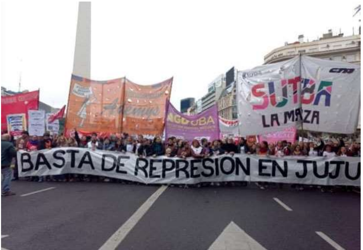
Manifestación en Buenos Aires en apoyo al pueblo de Jujuy en la defensa de su territorio

En ese marco, nos sumamos a la propuesta del PTS – cuya lista apoyamos en las elecciones internas del Frente de Izquierda – que plantea la necesidad de organizar una gran Asamblea de Trabajadores, Comunidades y todos los sectores en lucha de Jujuy, que sirva para organizar la lucha contra el gobierno de Morales y por una perspectiva política independiente de las fracciones patronales.