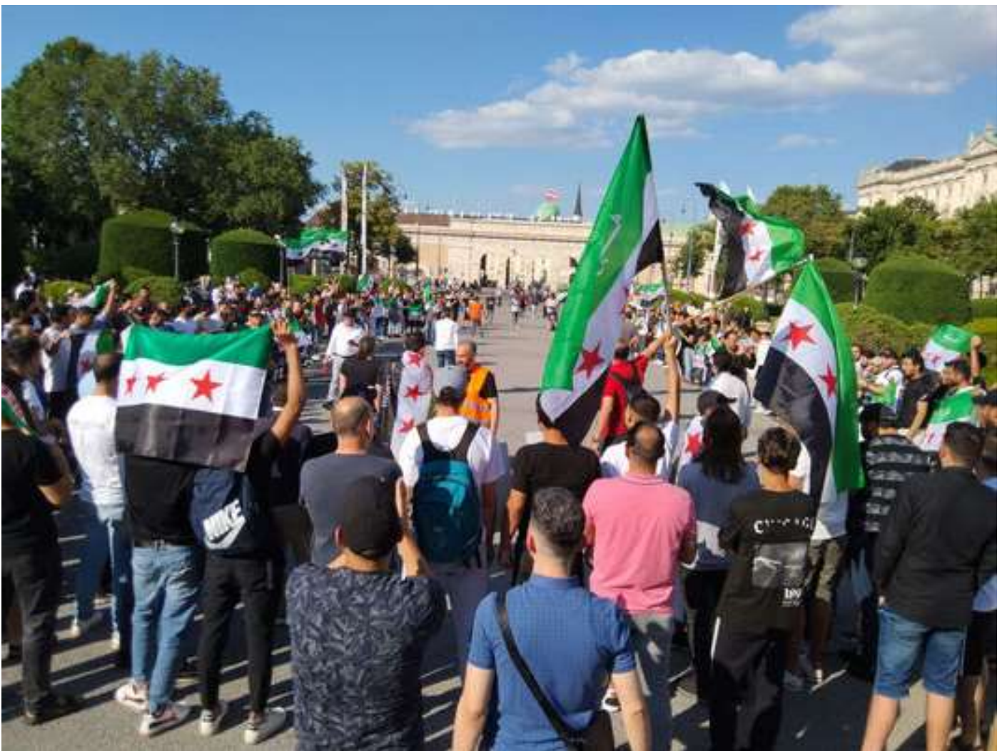
Manifestación de inmigrantes sirios en Austria en el marco del aniversario del Día Internacional en Apoyo a las Víctimas de Tortura.

Ver fotos y videoclips aquí: https://www.thecommunists.net/rcit/rcit-interventions-at-rallies-in-2023/#anker_13